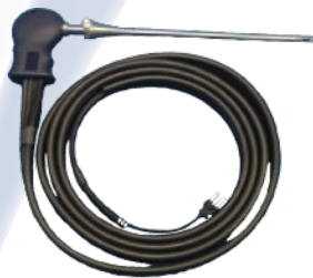
Table C - Sondas de Muestreo